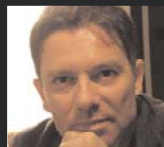
design Marco Valerio Agretti

MI SONO SEMPRE IMPOSTO DI DISEGNARE OGGETTI PENSANDO CHE CHI LI ACQUISTERÀ POSSA ESSERE SODDISFATTO DI UNA COSA, MAI SUPERFLUA, OLTRE LE MODE CON L'ORGOGGIO DI MOSTRARLA E DI POSSE- DERLA. PENSARE A UN OGGETTO AVENDO CHIARI QUESTI PRINCIPI RENDE TUTTO PIÙ IMMEDIATO E AGGIUNGE UN VALORE PRIMARIO AL PRODOTTO: L'ETICA.